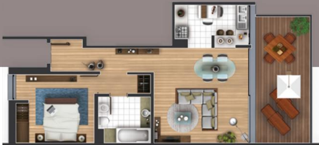
Planta da Tipologia T1